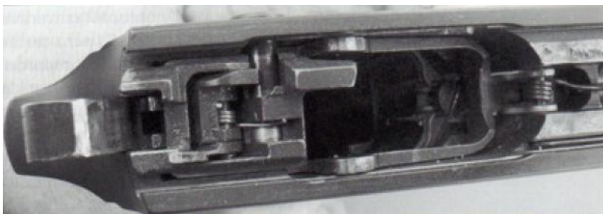
Vnitřek rámu s klasickou konfigurací pistole CZ 75.

zbraní, a podle mne našli nejlepší možné řešení.